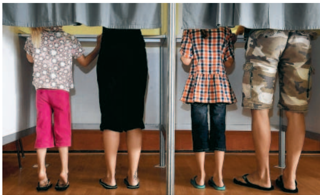
13.366 Liégeois n'ont pas rempli leur obligation dans l'isoloir ce dimanche.